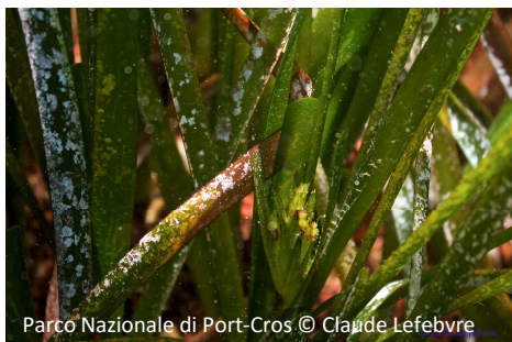
Posidonia oceanica Posidonia oceanica

Le vestigia del molo Romano e del relitto della tartana offrono rifugio ai giovani esemplari di un gran numero di specie. Gli habitat presenti sono: fondali rocciosi, fondali sabbiosi, fondali di Posidonia oceanica , il tutto a una profondità che non supera i 5 metri.