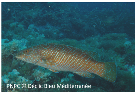
Tordo marvizzo Labrus viridis