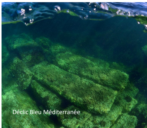
Vestigia della tartana