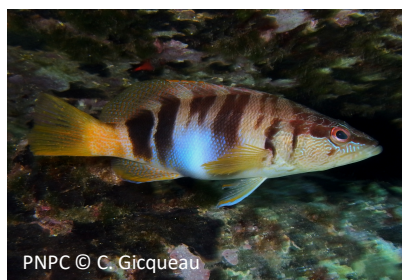
Sciarrano Serranus scriba