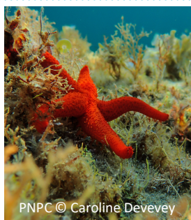
Stella marina rossa Echinaster sepositus