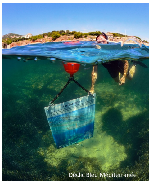
Percorso sottomarino di Olbia Cartello della tartana

Il percorso sottomarino di Olbia si trova sulle vestigia di una banchina romana, nelle vicinanze di un relitto di tartana carico di blocchi di roccia che offrono rifugio a numerose specie acquatiche.