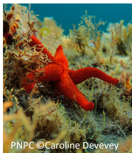
Etoile de mer rouge

Parc national de Port-Cros