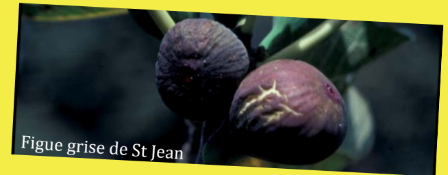
Figue grise de St Jean

La «violette de Solliès» est cultivée à grande échelle dans le Var pour être exportée vers Paris à la fin de l'été. La «Grise de la St Jean» donne deux récoltes par an et a des fruits savoureux, elle est idéale pour les jardiniers.