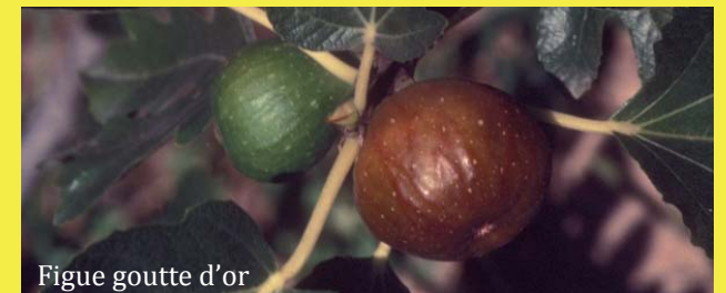
Figue goutte d'or