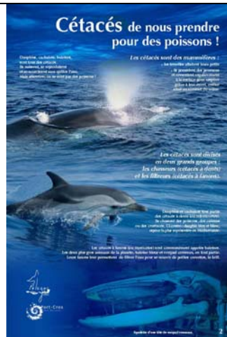
Cétacés de nous prendre pour des poissons !