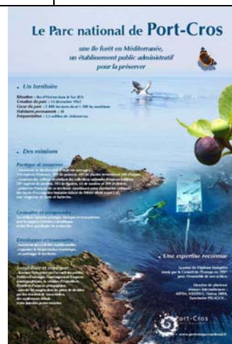
Le Parc national de Port-Cros, une île forêt en Méditerranée, un établissement public administratif pour la préserver