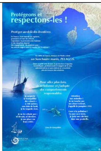
Protégeons et respectons-les