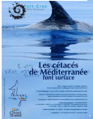
Les cétacés de Méditerranée font surface