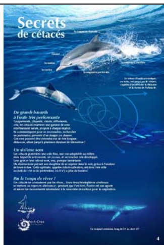
Secrets de cétacés