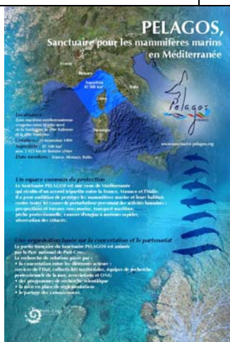
PELAGOS, Sanctuaire pour les mammifères marins en Méditerranée